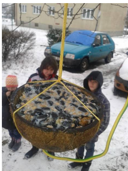
Krmítko pro ptáčky

Také v únoru jsme pokračovali v tematické tvorbě. Děti vyrobily ptáčkům krmítka, namalovaly spoustu výkresů na téma „Olympijské hry v Soči“.